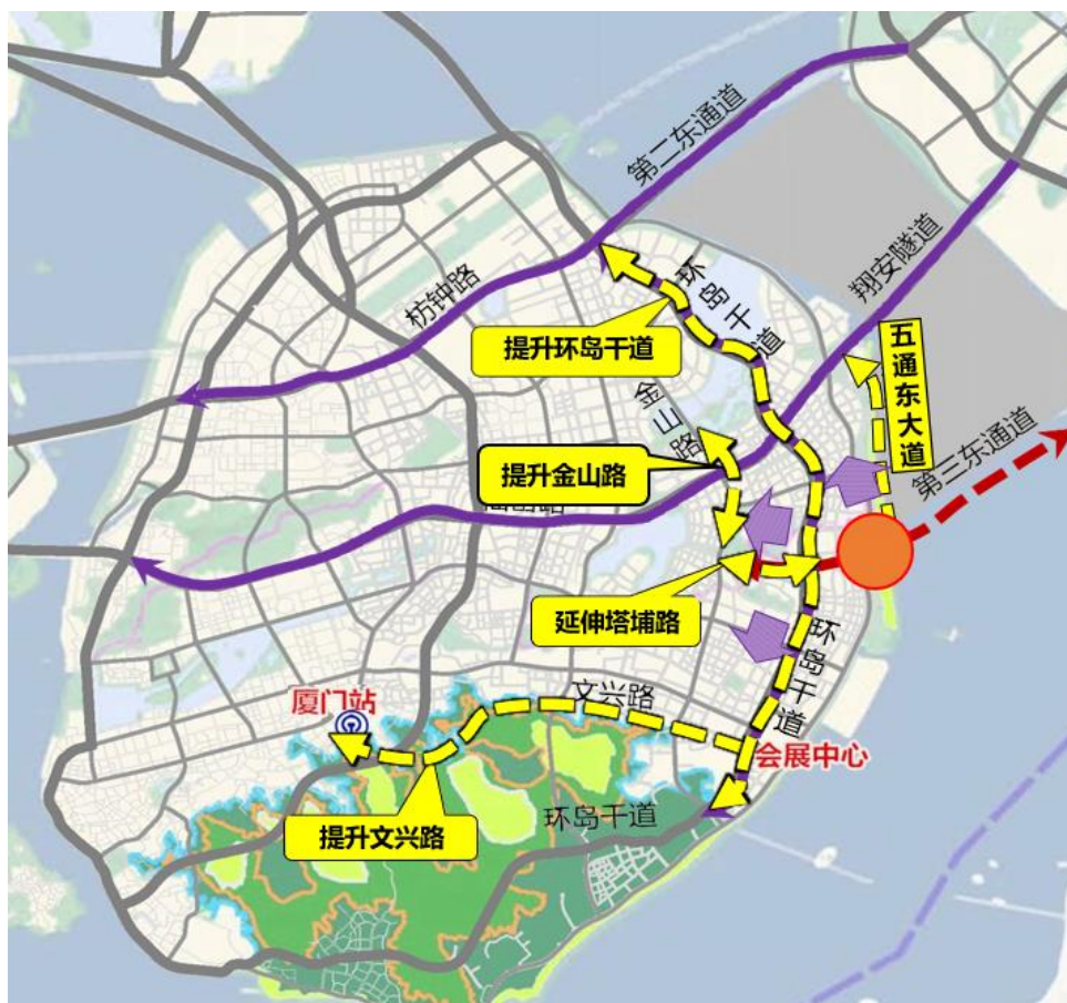
图一：“三纵两横”东部衔接路网提升改造示意图

厦门第三东通道是翔安机场快速疏散交通很重要的一条通道，项目起于厦门岛东部，跨越东部海域后接入翔安机场，全线采用高速公路标准，从本岛至翔安端采用双向八车道标准，翔安至机场采用双向六车道标准。设计速度 80km/h(海中段 100km/h)。